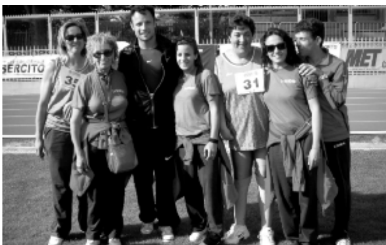
Oscar Pistorius, con gli atleti de "La Rondine"

«L'unico modo per superare i propri limiti è accettarli e amarli. La vita è una sfida quotidiana e lo sport insegna a lottare e a dare il meglio di sé»