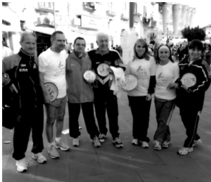
Un gruppo di atleti premiati.